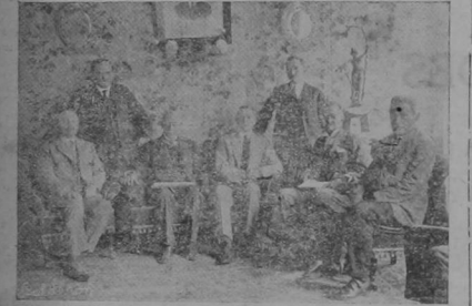
El Lic. Aguilar Barquero, acompañado del Presidente del Congreso y de los que habían sido miembros de su Gabinete, en el momento de recibir copia del decreto que lo declaraba benemérito de la patria.

ciudadanos distinguidos lo proclamó, el 2 de setiembre de 1919, para la presidencia de la república, a la caída del régimen del señor Tenorio. Se distinguió su breve período de gobierno por el respeto que puso en el restablecimiento de la concordia entre los costarricenses, por la pureza en el mando y por sus intereses públicos, por un austero y en otras palabras, por un noble afán de trabajo. Ejerció el poder hasta el 8 de mayo de 1920 en que hizo entrega de él al señor don Julio Acosta, Presidente constitucional electo en los comicios el 7 de diciembre del año anterior. Poco después, el congreso impuso su aprobación a todos sus actos de gobernante absoluto, en premio de sus afanes al servicio