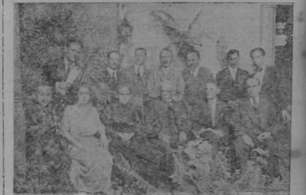
El Lic. Aguilar Barquero con su familia y los antiguos miembros de su Gabinete

en unión del Poder Ejecutivo concurrir a esos actos, los Poderes Legislativo y Judicial, los Señores Designados a la Presidencia, los Señores ex-Presidentes de la República, el Cuerpo Diplomático acreditado en ella, el Señor Arzobispo, los Señores Obispo de Alajuela, el Vicario Apostólico de Limón, el Alto Clero, los Generales de División y de Brigada, el Gobernador de la Provincia, la Municipalidad del Cantón Central, el Cuerpo Consular, el Colegio de Abogados, las Facultades de Medicina, de Farmacia, de Ingeniería y de Ciencias Dentales, la Junta de Educación de esta ciudad, la Cruz Roja, los Representantes de la Prensa, y el público en general.